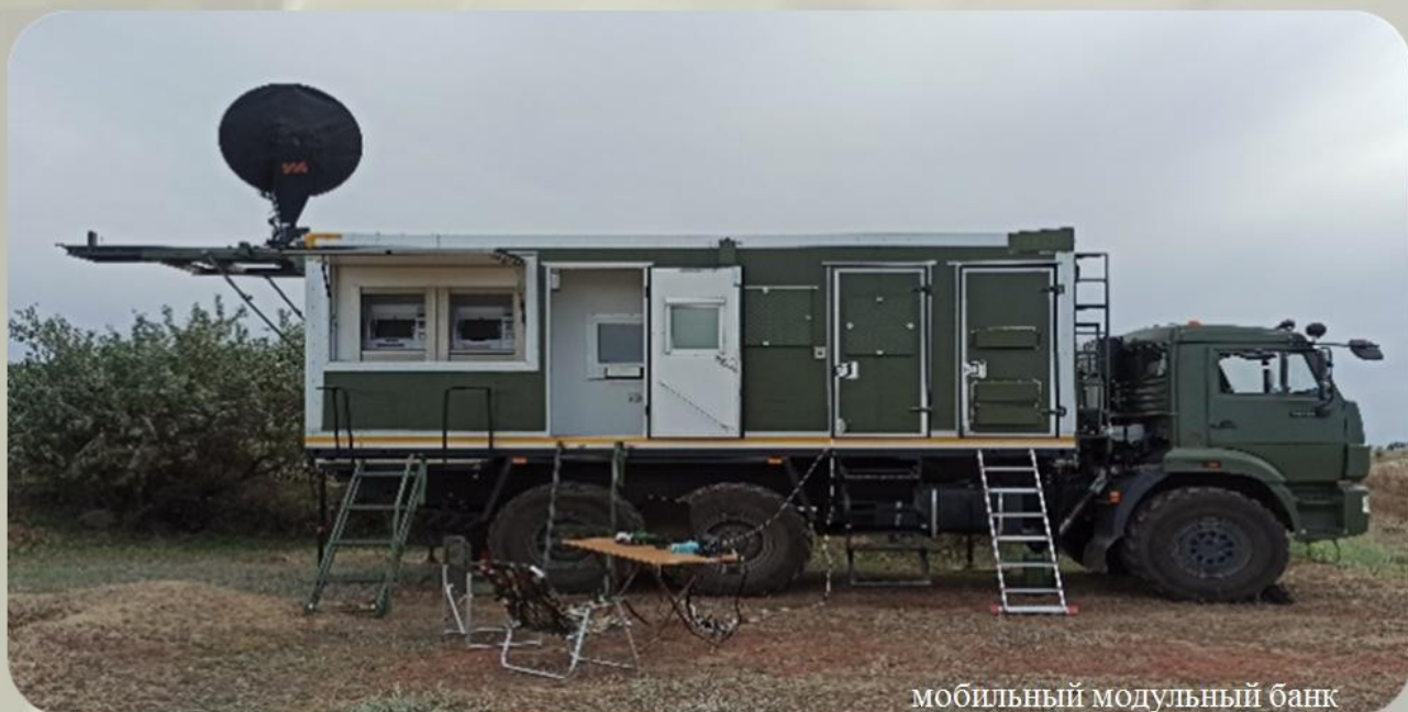
мобильный модульный банк